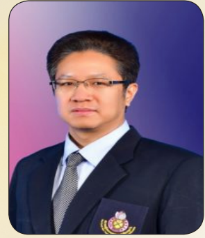
รองเลขาธิการ นายแพทย์พรพรม เมืองแมน