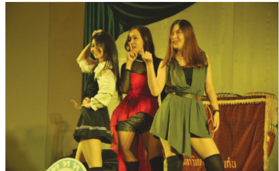
การแสดงของนักศึกษาแพทย์ มหาวิทยาลัยขอนแก่น