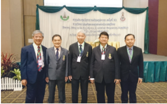
คณะผู้บริหารราชวิทยาลัยศัลยแพทย์ฯ ร่วมถ่ายภาพเป็นที่ระลึก