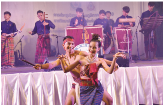
การแสดงโชว์ศิลปะพื้นบ้าน โดย ททท.