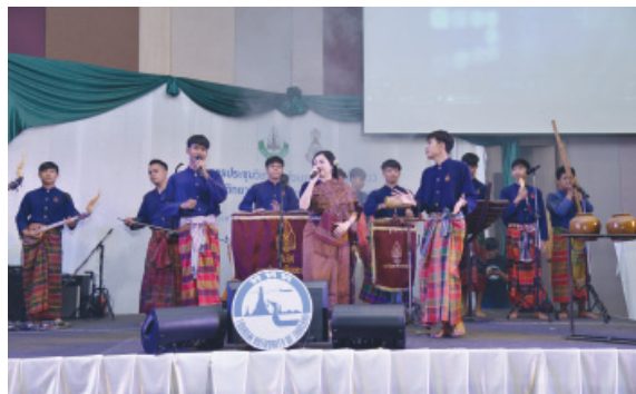
การแสดงโชว์ศิลปะพื้นบ้าน โดย ททท.