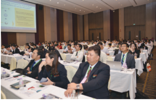
ผู้เข้าร่วมประชุมวิชาการฯ