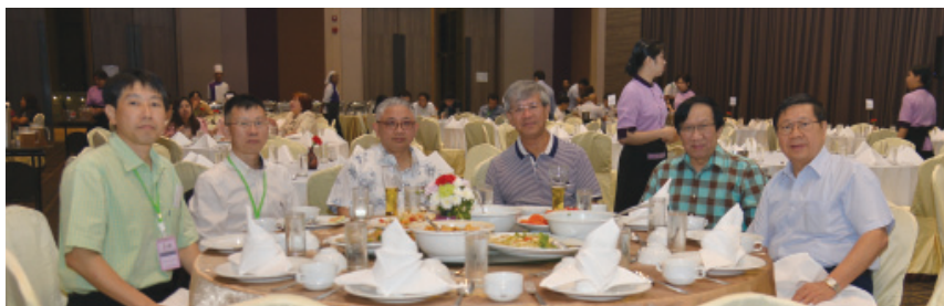
คณะผู้บริหารร่วมงานเลี้ยง Thai Night